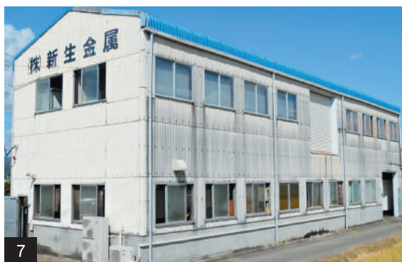
7 / 約50年の歴史を誇る工場建屋

あり、会社に迷惑をかけてしまうことが心配でした。でも、新生金属では従業員同士でフォローし合えるので、安心して休むことができます。この職場は、家庭と仕事の両立ができる環境が整っているのです。とても働きやすいです。」 会社としても、昨年1月には女性用トイレの整備、7月には工場内エアコンのリニューアルといった職場環境の改善に取り組んでおり、社員の働きやすさを第一に考えていることがうかがえる。また、同じく7月には工程管理ソフトウェアも導入され、生産性の向上と効率的な業務運営が図られている。これにより、従業員一人ひとりの負担が軽減され、さらに働きやすい職場が実現されつつある。