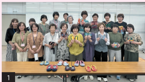
1/エコぞうり講習会

女性部では豊かな地域づくりの担い手として、事業を行ってまいりますので一緒に活動に参加してみませんか。ご興味のある方は商工会までお問い合わせください。