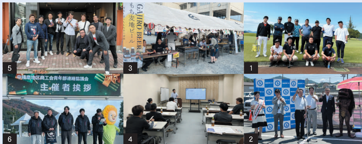
1/追出しゴルフコンペ 2/地ビール完成お披露目イベント 3/福崎夏まつり 4/マーケティングセミナー 5/視察研修事業 6/クリスマスマーケット

青年部では次年度も様々な事業や活動を予定しておりますので、ご興味のある方はぜひ商工会青年部事務局までお問合せください。